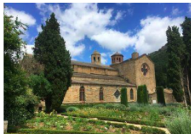
Abbaye de Fontfroide