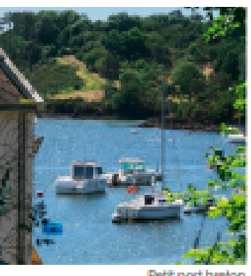
Baie de Trégunc