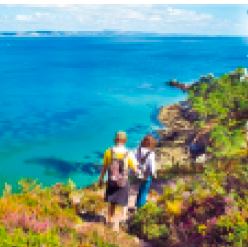
Randonnée presqu'île de Cr