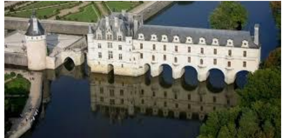
Château de Chenonceau